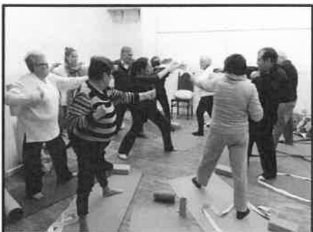
Sessão de Yoga