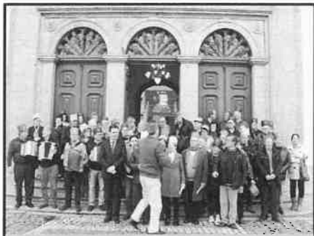
Grupo Cantares das Janeiras-ACUP