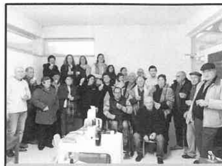
Turma de Hidroginástica