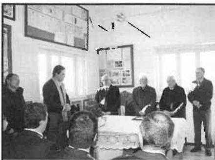
Posse Corpos Sociais - ACUP