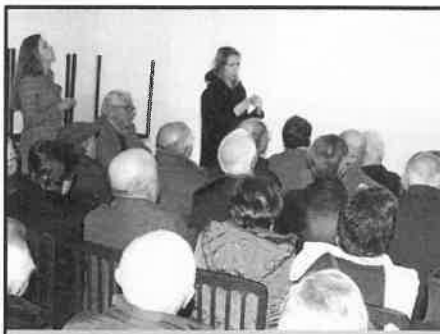
Palestra - Estatuto DFA