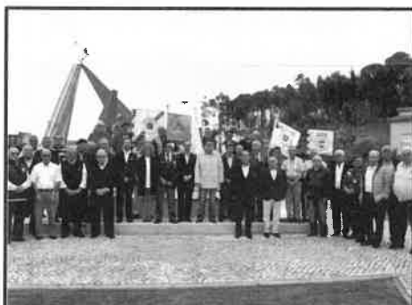
Aniversário A.C. de Tábua