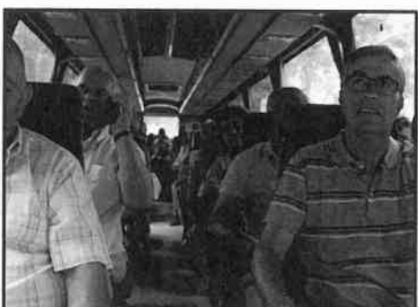
Passeio convívio da ACUP