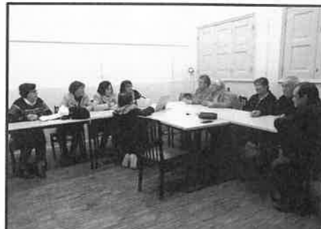
Atelier de trabalhos manuais