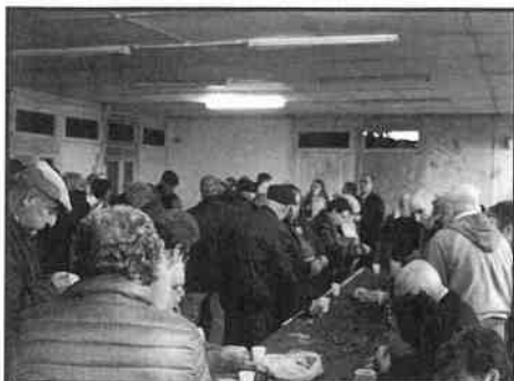
Magusto da ACUP