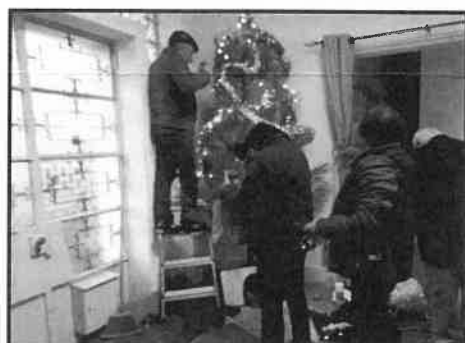
Preparar o Natal da ACUP