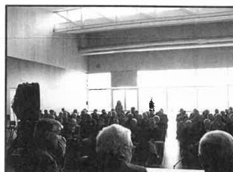
Assembleia Geral da ACUP